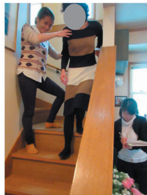
図29 <退院前共同ケアカンファレンス>