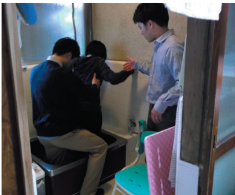
図28 <家庭訪問・家屋改修や福祉機器導入のアドバイス>

また、当院は開院当初から船橋市の地域活動に参画し、地域のケアマネジャー等退院後の生活を支援するスタッフと普段から顔の見える関係を構築できるよう、勉強会や事例検討会等様々な活動を企画運営し、さらなる地域連携の強化に取り組んでいます。(図30)