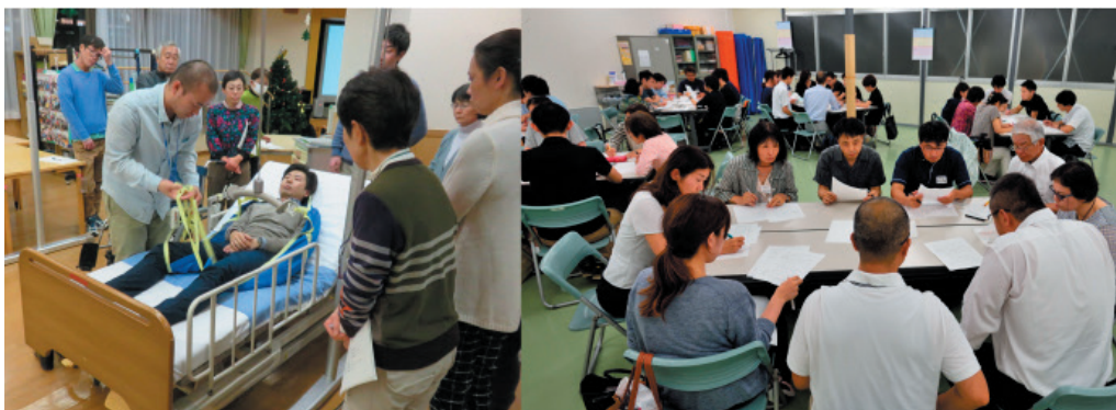
図30 <地域活動:福祉機器の勉強会と事例検討会>

退院の1か月くらい前に、療法士が患者さんを同伴して家庭訪問し、自宅の浴槽の出入りや玄関の出入りの動作等を確認し、御家族やケアマネジャー(介護支援専門員)とも相談して家屋改修や介護用具の必要性を検討します